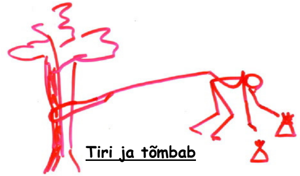
Tiri ja tõmbab